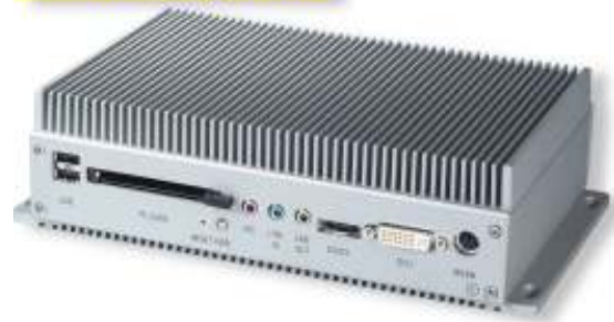
Advantech - UNO-2172 Gömülü Otomasyon Bilgisayarları